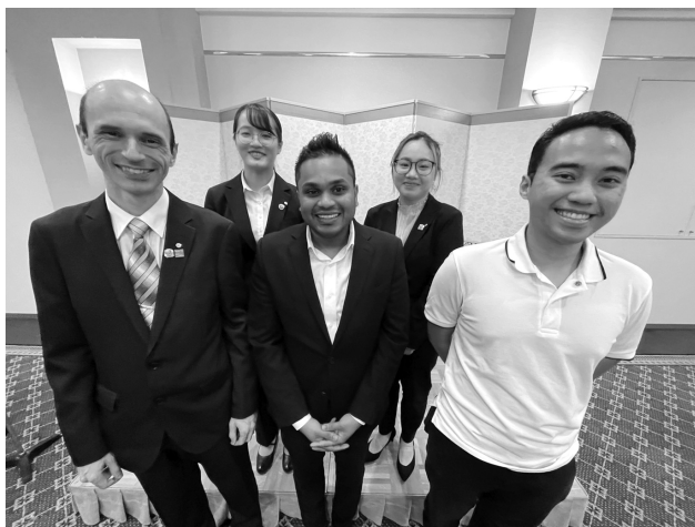
7/20 第2分区(B)米山奨学生歓迎会